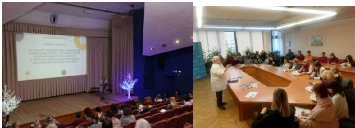
Фото 15-16. Семинары-практикумы по адаптации и социализации детей с расстройствами аутистического спектра (РАС), с ОПФР

городская поликлиника» г.Минска, сектора специального образования Центра дошкольного, начального и инклюзивного образования ГУО «Минский городской институт развития образования». В ходе семинаров-практикумов специалисты поделились опытом работы по адаптации и социализации детей с расстройствами аутистического спектра (РАС), с ОПФР, по включению таких детей в социум в целях их развития и реализации возможностей (фото 15-16).