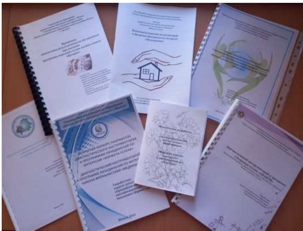
Сборники диагностических материалов по различным профилям