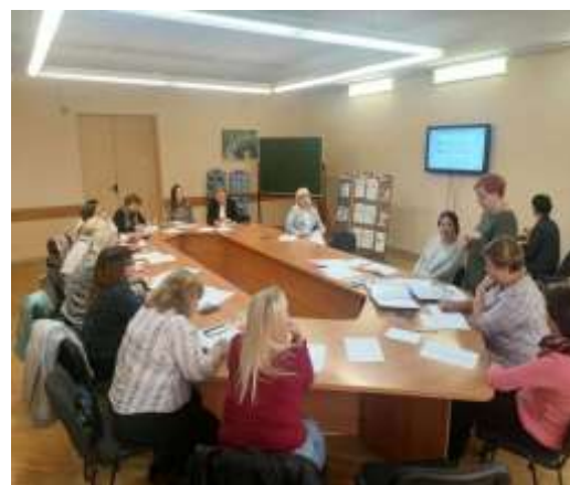
Фото 6-7. Веб – семинар «Методический кластер как объект управления: задачи, возможности, технологии развития»

В целях формирования высокопрофессионального коллектива педагогов, методистов, специалистов и управленцев, обладающих необходимыми компетенциями в информационно-коммуникационных технологиях, продолжилась реализация программы информационно-методического обеспечения «Цифровая культура педагога в образовательной среде учреждения дополнительного образования детей и молодежи». Программа предусматривает повышение уровня компетентности педагогических работников УДОДиМ г.Минска в области использования информационно-коммуникационных технологий и направлена на укрепление сетевого взаимодействия педагогов дополнительного образования в условиях единой цифровой образовательной среды УДОДиМ; информационно-методическую поддержку педагогов в процессе непрерывного профессионального образования. Особое значение приобретает развитие умений самостоятельной учебной деятельности и способности выстраивать индивидуальные образовательные траектории, совершенствовать и обновлять