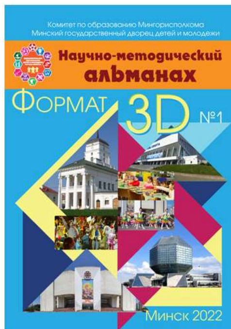
Фото 12. Первый выпуск научно-методического альманаха «Формат 3D»

Всего во втором выпуске будет опубликовано 25 статей.