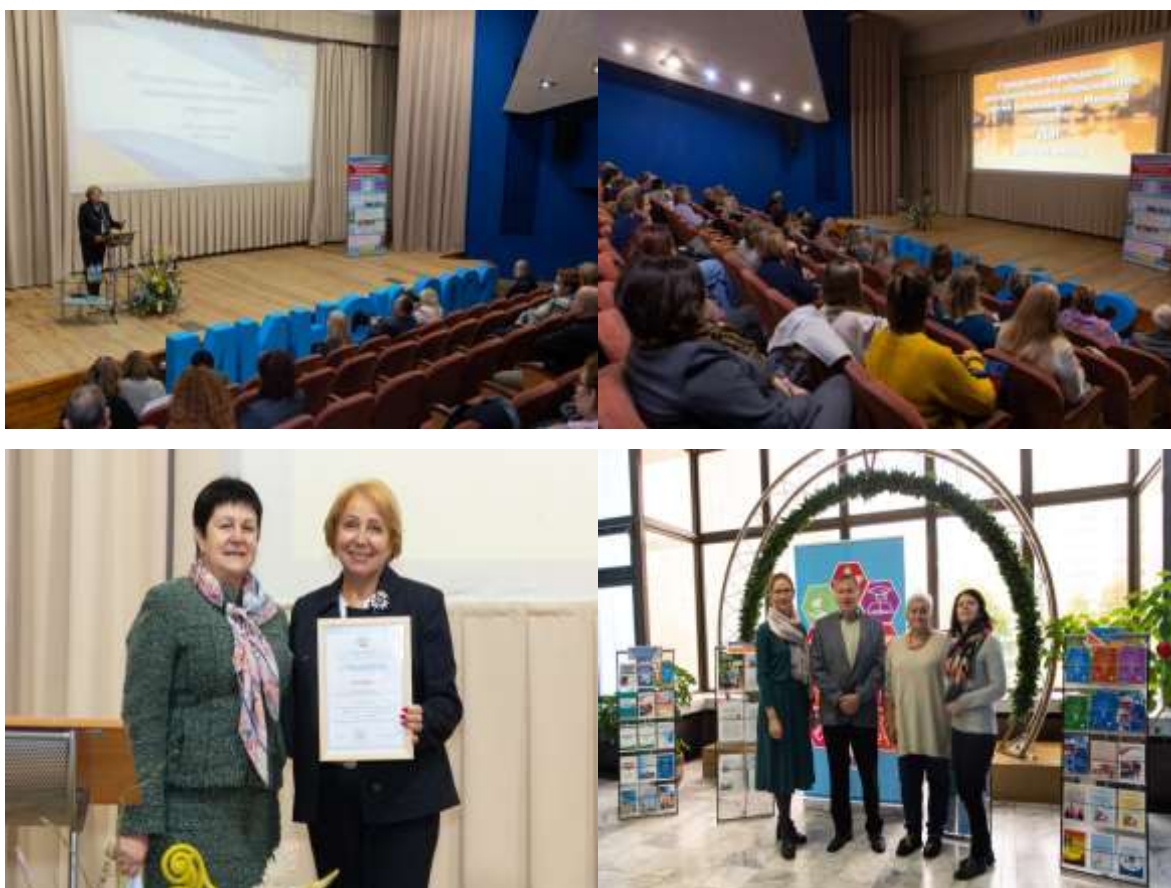
Фото 2-5. Открытие Методической недели

Методическая Неделя позволила провести мониторинг профессиональной деятельности педагогов дворца, наметить перспективные пути развития, выявить положительный опыт педагогической деятельности и повысить профессиональную квалификацию педагогов (фото 2-5).