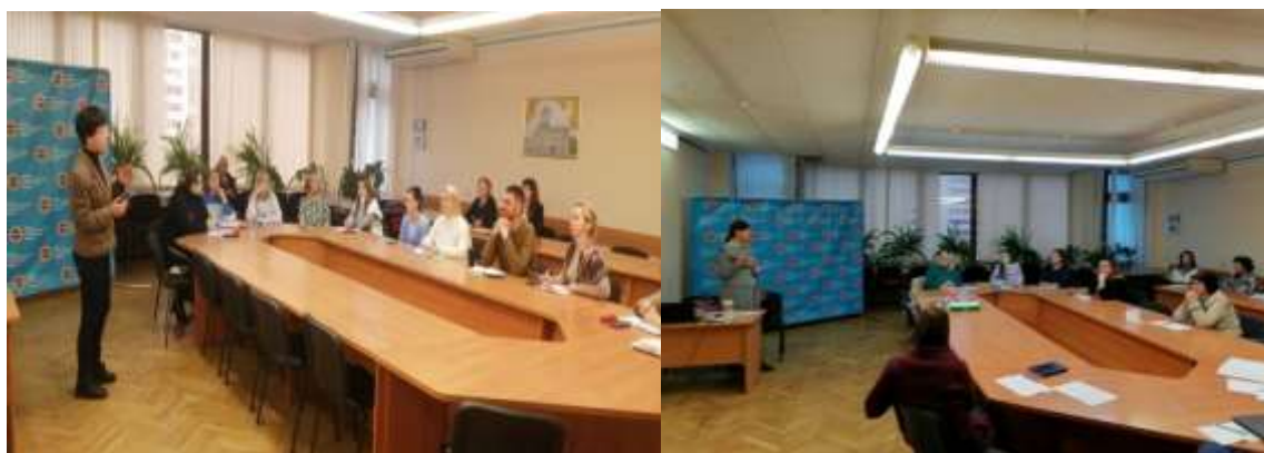
Фото 13-14. Обучающий семинар «Нормативное правовое обеспечение организации и проведения аттестации в учреждениях дополнительного образования детей и молодежи».

Обучение педагогических работников в межкурсовой период осуществлялось в рамках спецкурса «Современные подходы к аттестации педагогических работников». Проведены обучающие занятия «Алгоритм подготовки педагога к аттестации», «Нормативное и правовое обеспечение организации и проведения аттестации в учреждениях дополнительного образования». Для молодых специалистов г.Минска проведены: интенсив (обучение) «Эмоциональный интеллект как фактор успешной адаптации педагога», тренинги по развитию навыков конструктивного общения (фото 13-14).