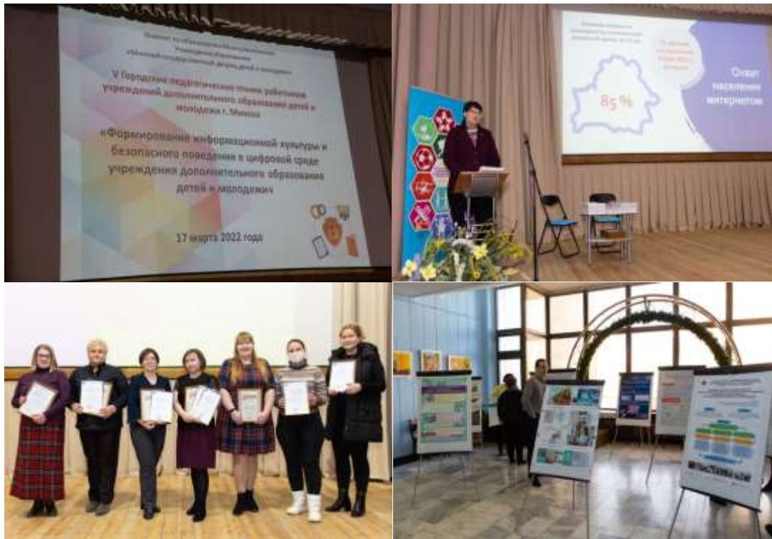
Фото 8-11. V Городские педагогические чтения

Одним из приоритетных направлений работы методических служб УДОДиМ в рамках сетевого взаимодействия является совершенствование программно-методического обеспечения образовательной практики. Эффективность работы по повышению качества программ объединений по интересам обеспечивается в рамках опорной методической площадки «Система работы по созданию в столичном регионе комплекса программно-методического обеспечения в дополнительном образовании детей и молодёжи» и включает такие виды деятельности, как методическое сопровождение программ, методическая экспертиза (внутренняя и внешняя), обучающие мероприятия (мастер-классы, семинары, вебинары, медианары), конкурсы (Приложение 8, https://disk.yandex.ru/d/x2xL6And3xnyuQ , папка «Семинары, вебинары»).