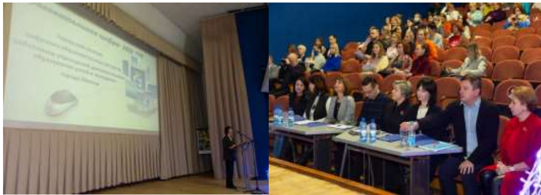
Фото 17-18. Открытие «Образовательной цифры – 22»

Традиционным стало участие педагогов УДОДиМ в городском конкурсе «Опыт и инициатива педагогов – ресурс образования столицы - 2022» на присуждение премий и грантов Мингорисполкома. Конкурс проводится в целях стимулирования и социальной поддержки творческого труда педагогических работников, выявления и распространения лучших образовательных практик (в 2022 году 10 УДОДиМ подали 12 материалов, 6 отмечены премией Мингорисполкома, приложение 12).