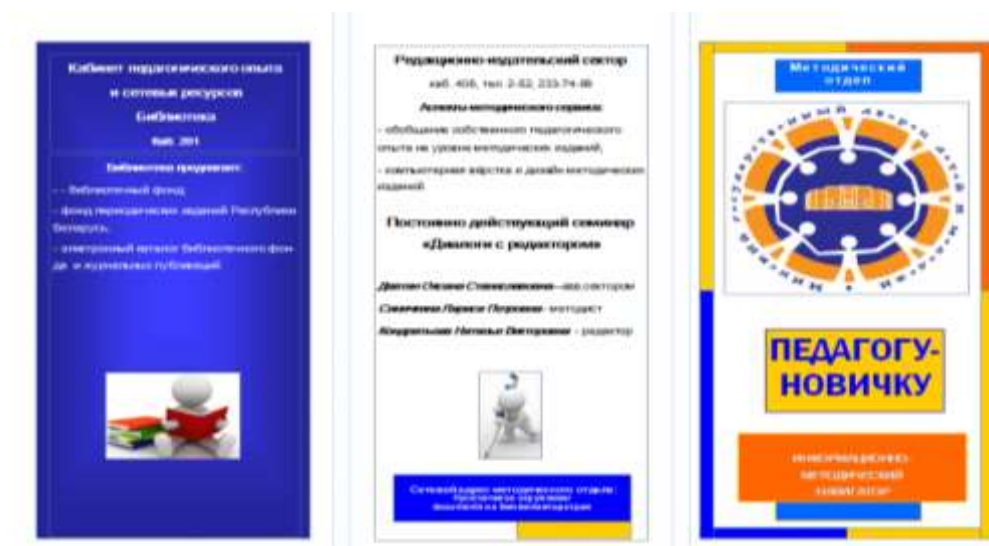
Фото 1. Буклет педагогу-новичку

образовательный двухдневный интенсив «Эмоциональный интеллект как фактор успешной адаптации педагога», который был организован для молодых специалистов дворца и УДОДиМ г.Минска. 19 молодых специалистов учреждений дополнительного образования детей и молодёжи г. Минска приняли активное участие в интенсиве. Учебная программа была разработана для создания условий адаптации молодых специалистов в трудовой среде и способствованию профессиональной самореализации педагога. В интенсиве приняли участие молодые специалисты, педагоги дополнительного образования города Минска. Каждый участник получил буклет – памятку «Педагогу-новичку» (фото 1).